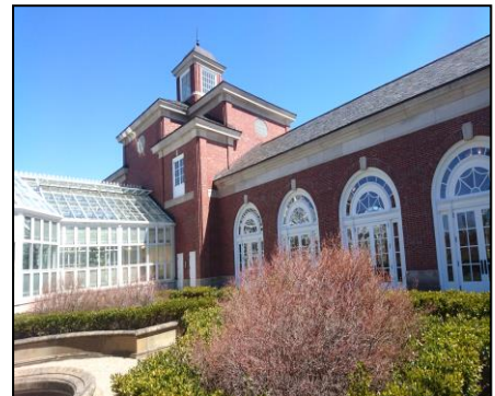
↑美術館のような大学にも訪問しました