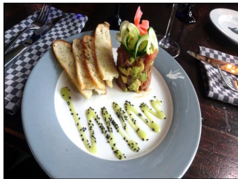
↑美味しい料理もたくさんいただきました！

今後、この技術が世界各地 に広がり、最終的には世界的 な省エネ社会の実現へ繋がっ てほしいと願っています。