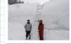
気象観測機を設置中。