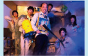
映画「宮田バスターズ(株)」より

俳優をしています。主に映画への出演をメインに活動しています。出演映画は小規模のものが多く、ミニシアターや、都内の映画館で単館公開されることが多いです。全国公開の映画に沢山出演できるよう、頑張っていきたいです。大学四年生の時、「今までこんなに勉強したことあったっけ?」というくらい卒業研究に没頭することができました。本当に充実した学生生活でした。研究では、失敗しても方法を変えてまた挑戦し、地道な努力を継続する力が必要です。それはどんな仕事でも同じで、今の仕事が大学の専攻に全く関係なくても、分厚い卒業論文を書き上げた事実は、とても大きな自信になっています。少人数制で先生方との距離が近い恵まれた環境なので、落ち着いて勉強したい方には本当にオススメの大学だと思います。