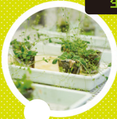
生産科学科 植物基礎系 生産科学コース 関根 政実 教授